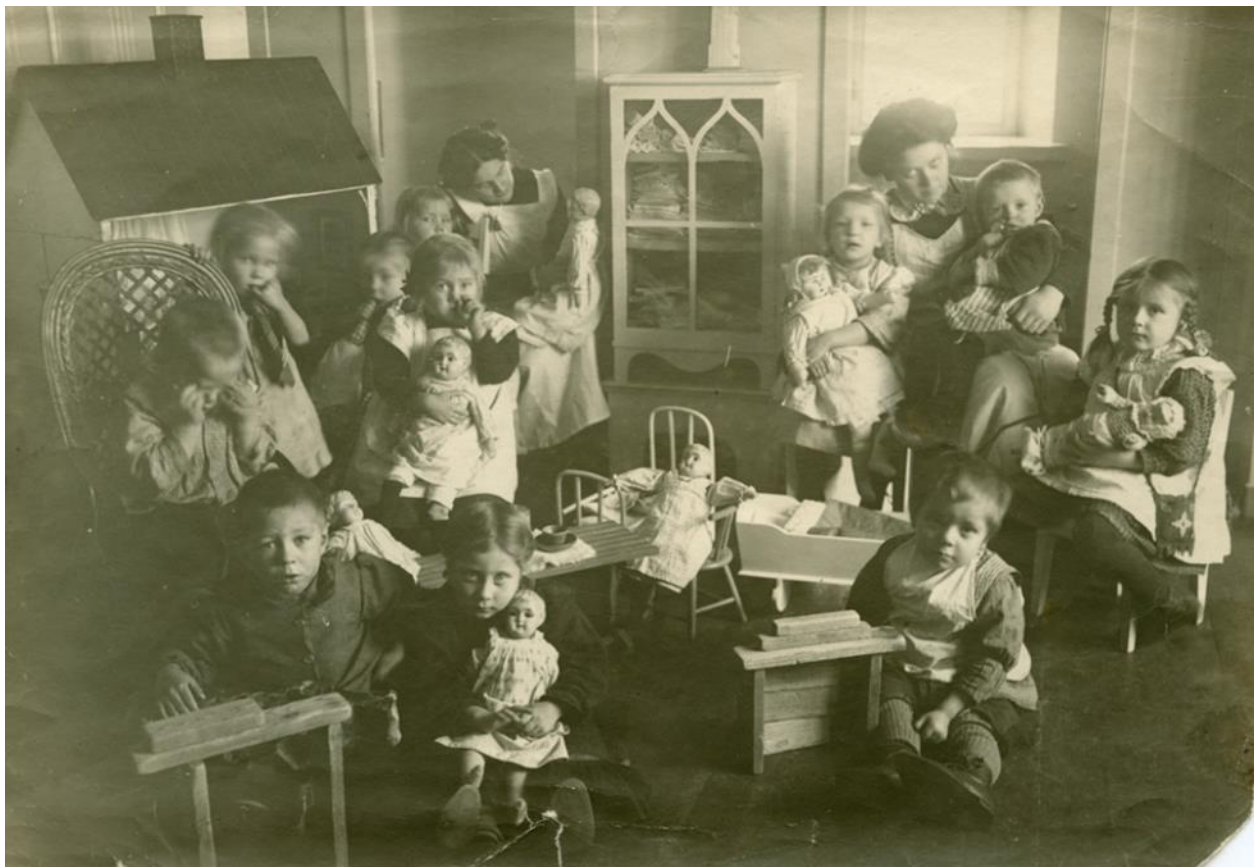
Lapsia leikkimässä kotileikkiä Ebeneserin lastentarhan leikkihuoneessa, 1910-luku.

Museokierros toisen asteen opiskelijoille